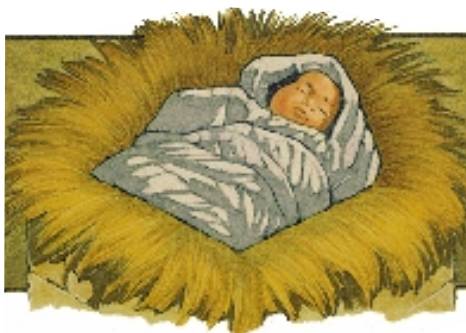
Jesús cumplió más de 125 profecías del Antiguo Testamento concernientes al Mesías.