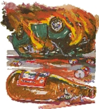
Negarse a abstenerse del alcohol ha traído problemas a muchos.