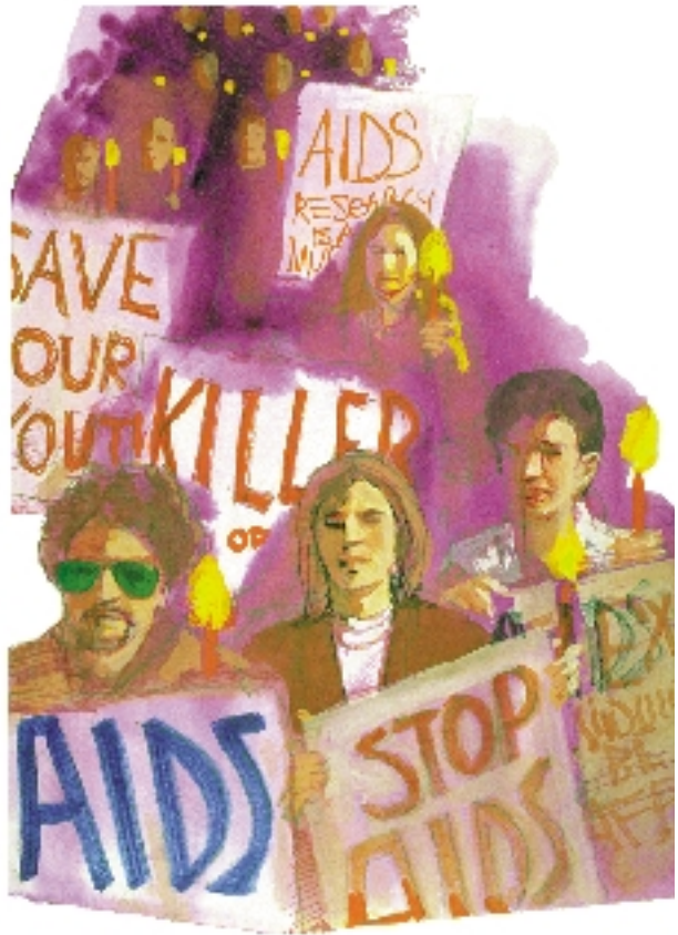
La terrible plaga del SIDA no existiría si se obedecieran las antiguas leyes de Dios concernientes a la moralidad.